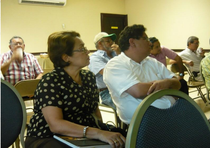
Varios gremios del sector agropecuario se han hecho presentes en las reuniones del Frente Unido por Chiriquí.